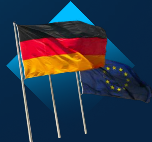
Anerkannten und beglaubigten Übersetzern bei der deutschen Botschaft Rabat