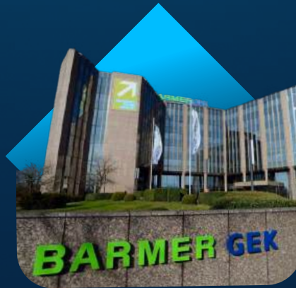
Der Barmer Krankenversicherung